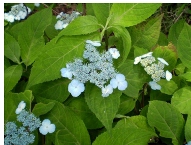
甘茶の木はあじさいのような花 経蔵付近に植えています。