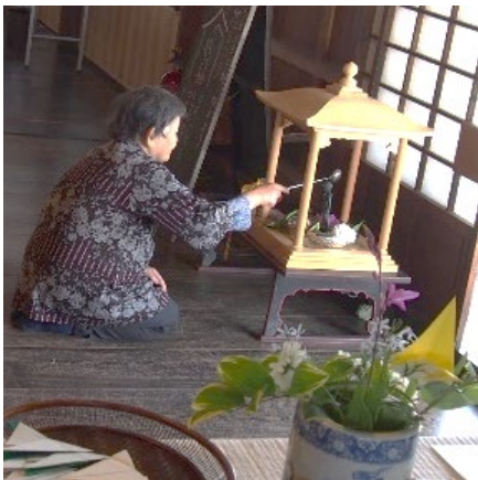
花みどうに甘茶をかけてお参り

去る5月12日、お釈迦様のご誕生を祝う花まつりを開催しました。おつとめのあと、甘茶を一服。お天気にも恵まれ、のんびりと境内の各地でくつろいでもらう日となりました。