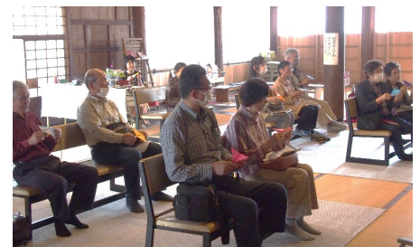
折り紙と歌の時間