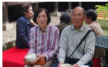
お茶席ももうけました。 住職がお抹茶をたてました。