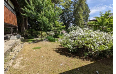
仏足石まで白いツツジが点々と…